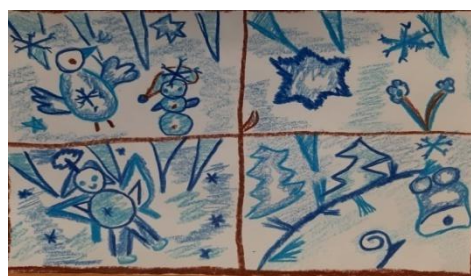
Autorka: Mária Pustajová IV.A