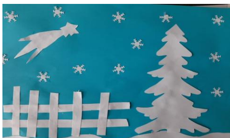
Autor: Erik Bartoš IV.B

Milí čitatelia, opäť vychádza nové číslo nášho školského časopisu. Tak ako vždy aj teraz dúfame, že Vám prinesie mnoho zaujímavého, poučného a vtipného.